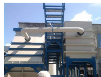
Reaktor / Separácia

Viac informácií nájdete aj na www.wtc-macro.com