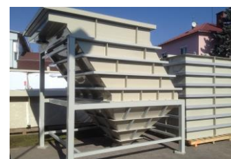
Komorový reaktor/Lamelový separátor