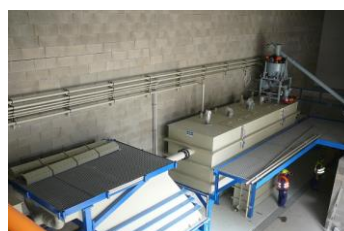
Komorový reaktor/Lamelový separátor